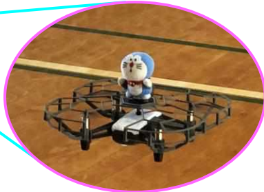
ドラえもんを乗せたドローン をプログラムで制御しました。

令和2年(2020年)オリンピック・イヤーがスタートしました。今年は、十二支の1番目子年(ねどし)です。ねずみ年生まれの特徴として、コツコツ努力し細かいことに気を利かせることができる男性、素直で温厚で人に好かれやすく笑顔が素敵で魅力的な女性だそうです。