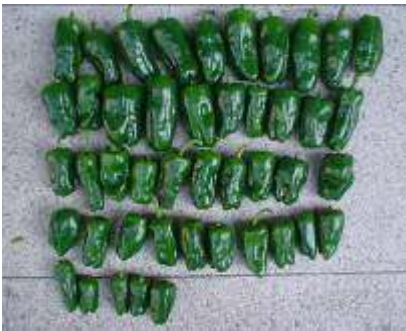
ピーマンとじゃこのからし醤油あえ