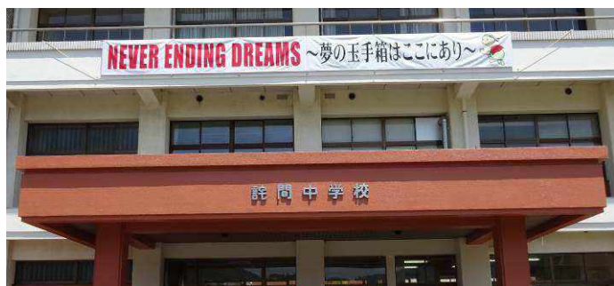
生徒会スローガン横断幕（左） 学級旗の制作風景（右）